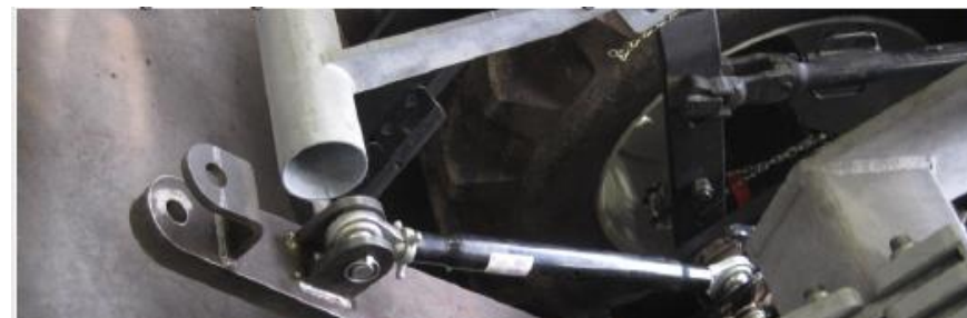
Zugdeichsel vom Schlepper zur Kartoffellegmaschine