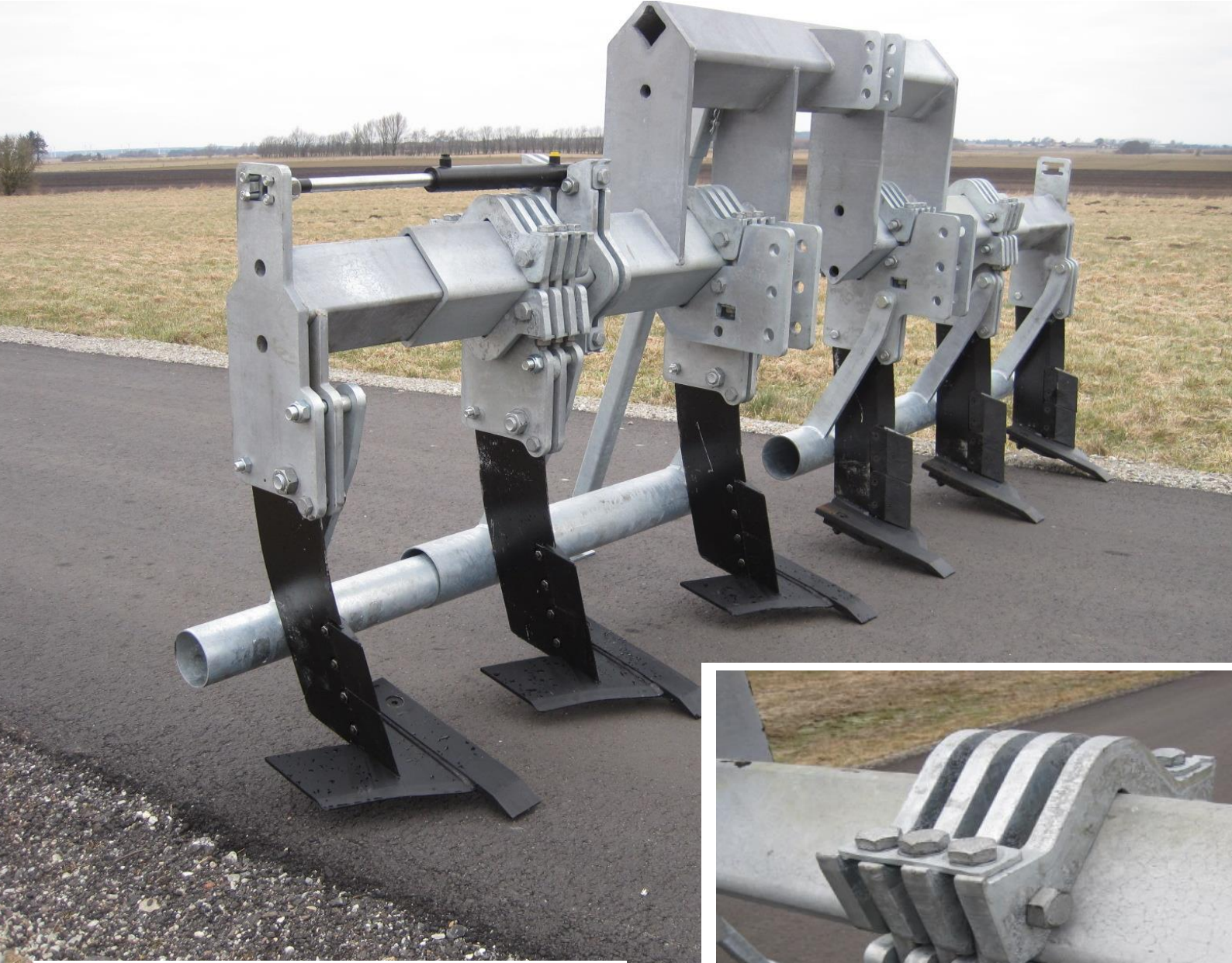
Agri Seem Gruberschare mit effektivem Rohrbalken