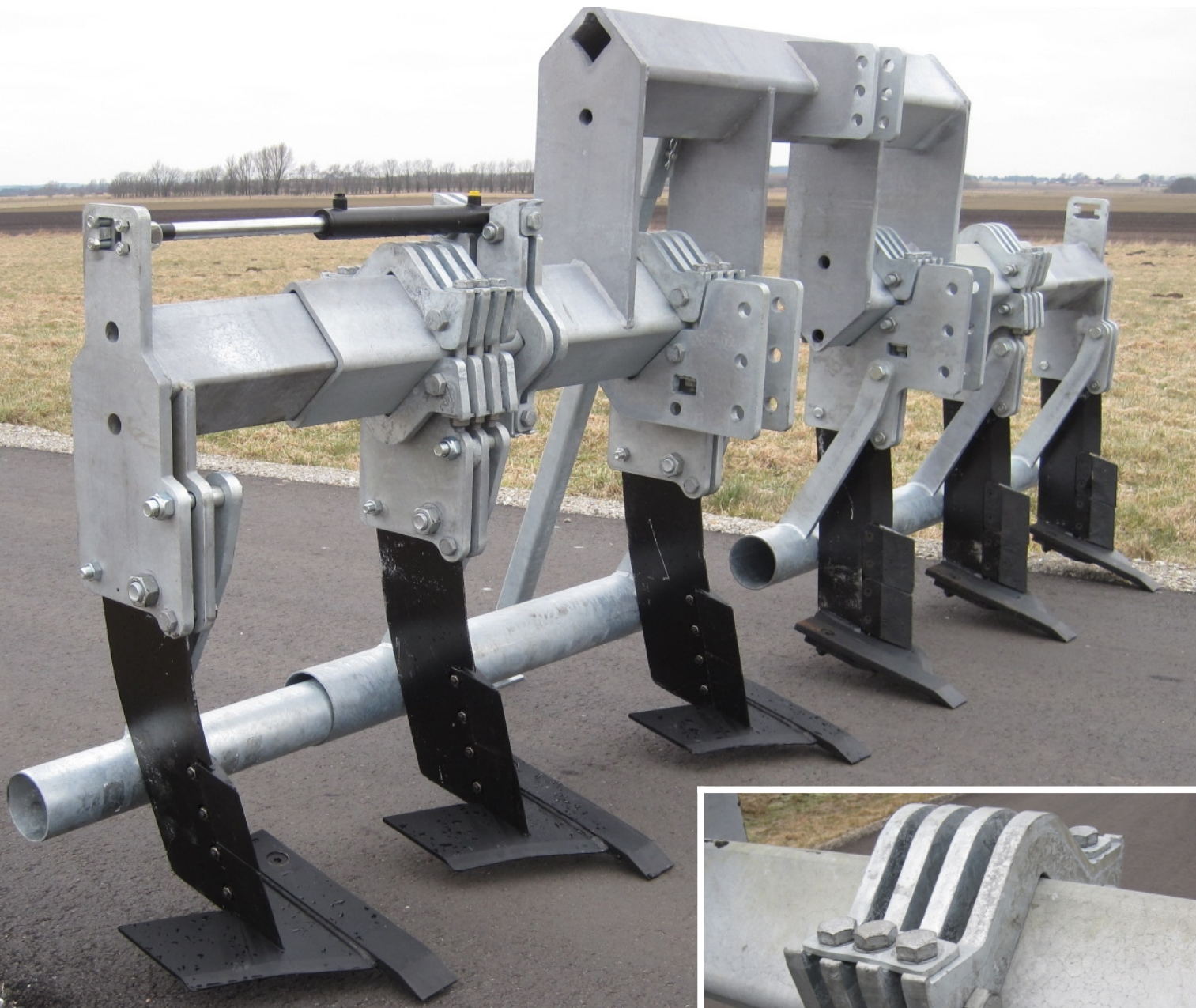
Agri seem grubbe tænder med efterfulgt slæberør