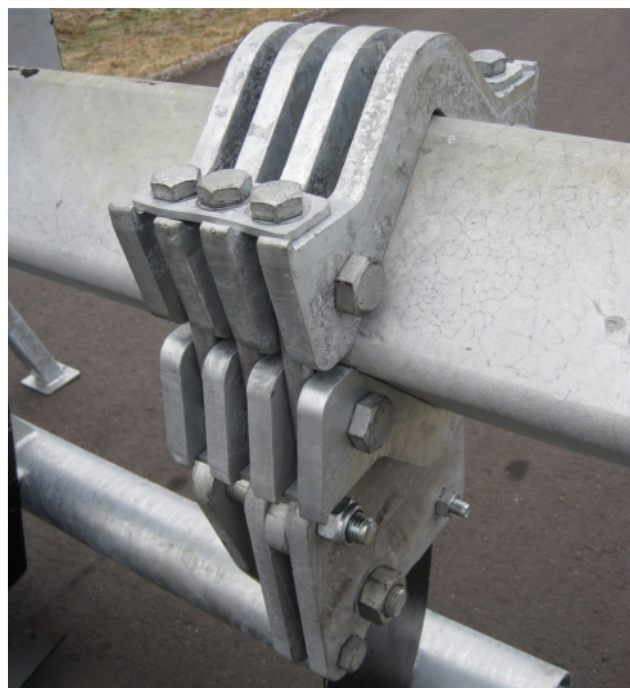
Flexibel tandafstand 18mm Boltsikring