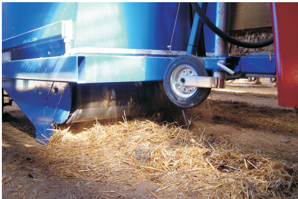
Næsten som at trylle: Hokus Pokus halmen er væk