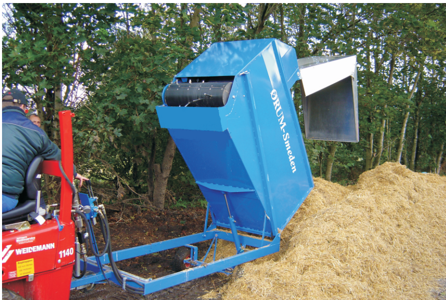
Overbygning åbner automatisk ved af tipning 2500L comprimeret halm er en stor mængde halm