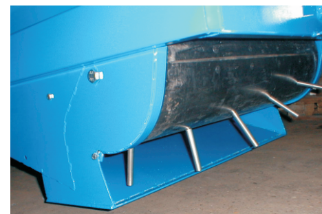
Picupen med opad vendt sideskær hindrer halmen slæber i siderne