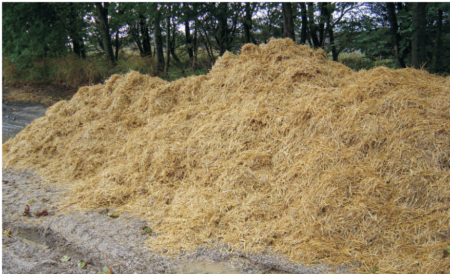
På rekordtid er halmen kørt ud i en bunke et sted, væk fra farmen. Bemærk: ingen spild når det er en lukket kasse med låg