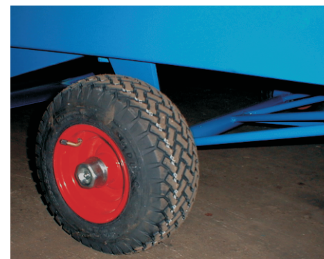
Hjulaksel forberedt for drej Store hjul 140 x 6