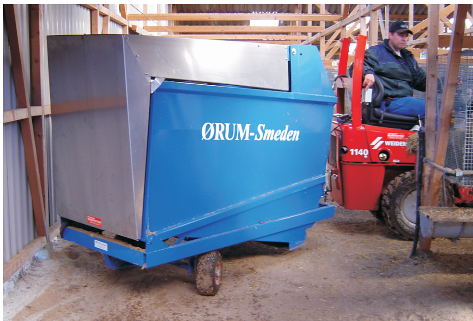
Hjulaksel med drej giver let adgang, hvor pladsen er knap