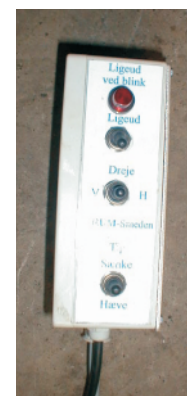
El-hydraulisk styring (extraudstyr) Styrebox kan frit placeres ved førerens side. Alle funktioner kan styres herfra.