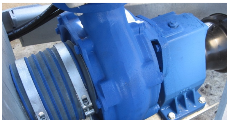
Højtrykspumpe for kanon.