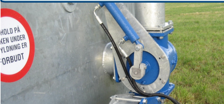
Trevejshane, hydraulisk eller manuel betjening.