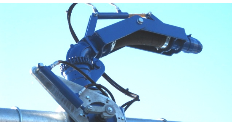
Hydraulisk drejebær højtryks kanon Højdeindstilling som fast, eller hydraulisk regulerbar.