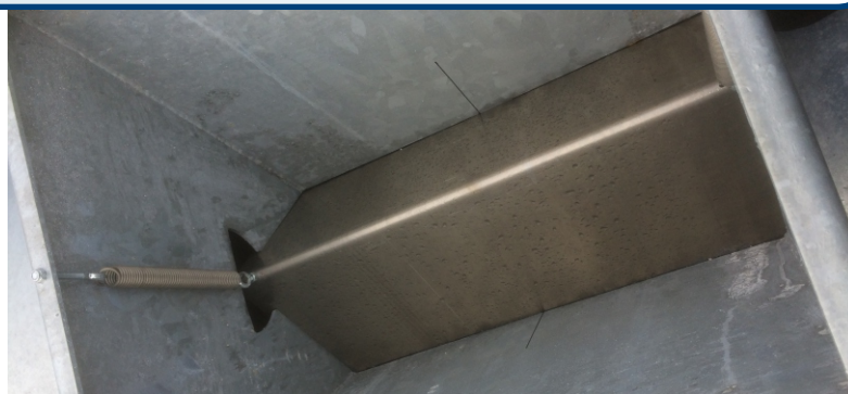
Automatisk lukke i fyldetrakt.